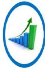
ความมั่งคั่ง