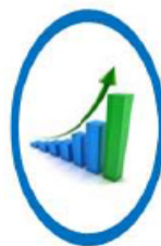
ความมั่งคั่ง

• ประเทศ มีความมั่นคง ในเอกราชและอธิปไตยมีสถาบันชาติ ศาสนา พระมหากษัตริย์ที่เข้มแข็งเป็นศูนย์กลางและเป็นที่ยึดเหนี่ยวจิตใจของประชาชน ระบบการเมืองที่มั่นคงเป็นกลไกที่นำไปสู่การเป็นประชาธิปไตยที่ก้าวหน้าไปสู่ความเจริญรุ่งเรือง